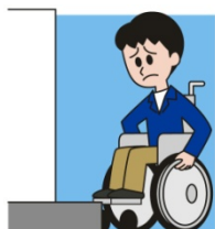
キヤップハンディ体験